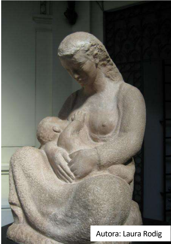
Autora: Laura Rodig