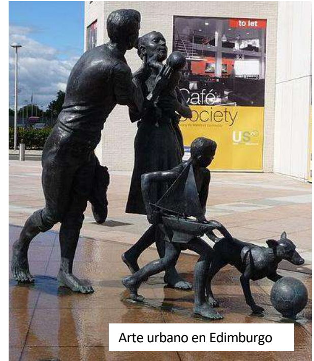
Arte urbano en Edimburgo