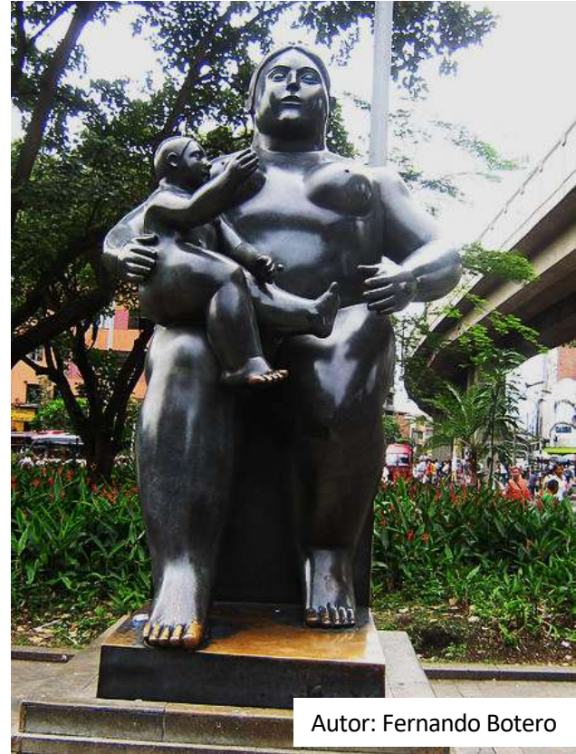
Autor: Fernando Botero